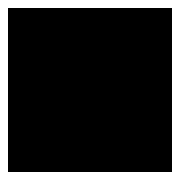
Deep Black Ref 8502