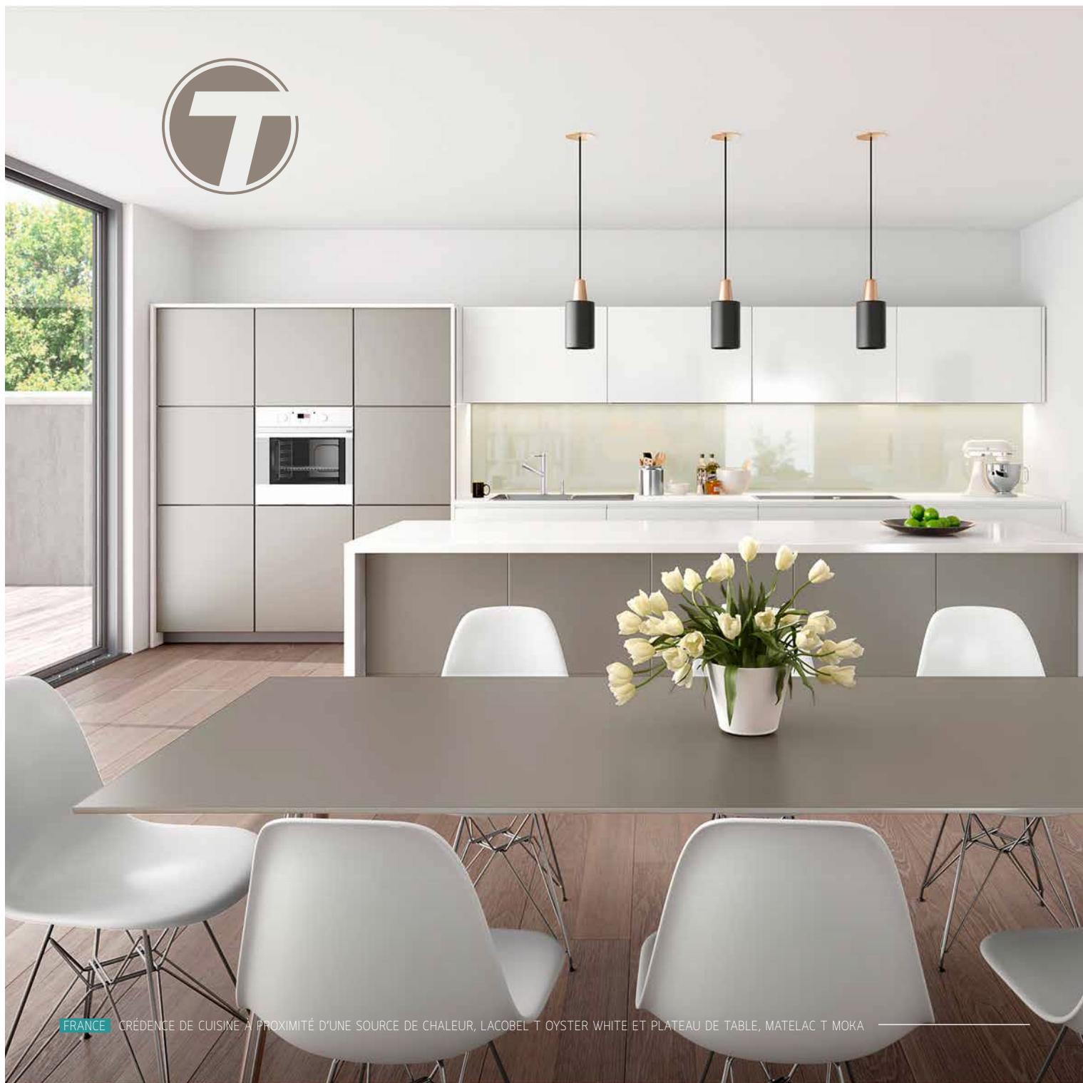
FRANCE CRÉDENCE DE CUISINE À PROXIMITÉ D'UNE SOURCE DE CHALEUR, LACOBEL T OYSTER WHITE ET PLATEAU DE TABLE, MATELAC T MOKA