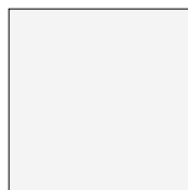
Cool White Ref 1502