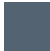
Zen Grey Ref 6005